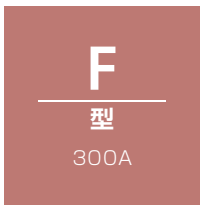
F型300A(凸側)L=450 本体参考重量 150kg